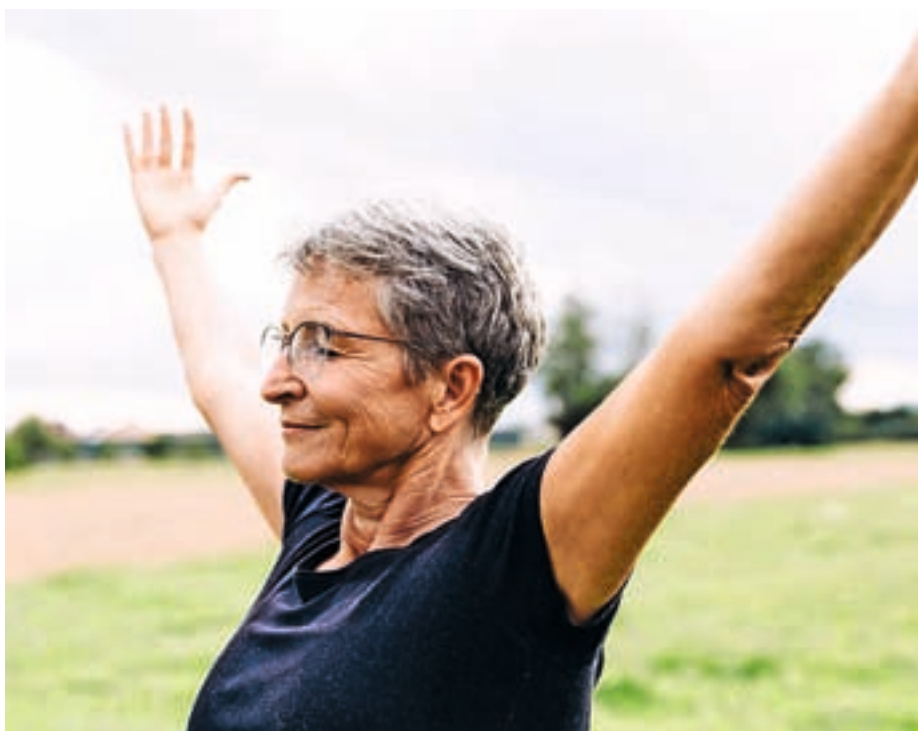
S pametno skrbjo za svoje zdravje pomagamo tudi bližnjim k boljšemu zdravju.

Glavni je celostno gledanje na človekovo zdravje; torej spoznanje, da je zdravje kakovostno delovanje vseh človekovih razsežnosti v neločljivi medsebojni povezanosti. Ko so v opredelitvi zdravja izrecno omenili duševno in socialno blagostanje, se je pozornost razširila s telesne razsežnosti tudi na duševno, duhovno, socialno, razvojno in bivanjsko. Drugi razlog tiči v tem, da je celostna opredelitev zdravja pozornost zdravstva, politike in ljudi usmerila z