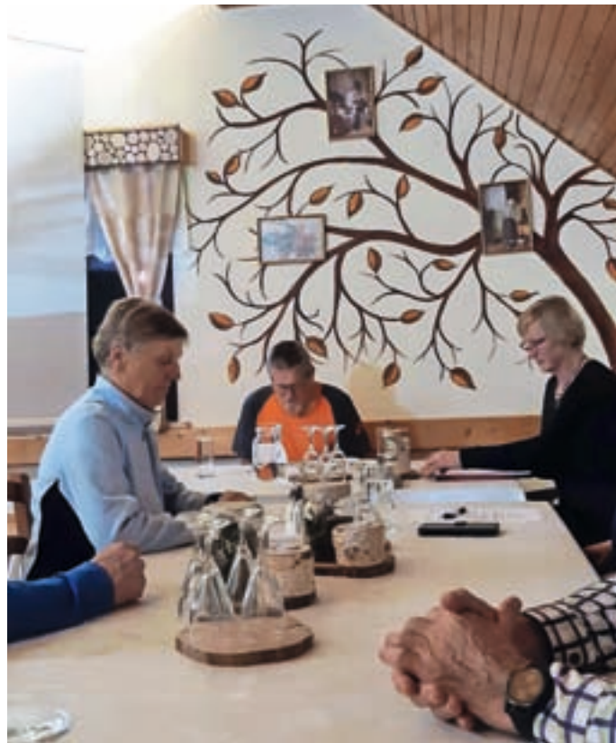
Člani Romarskega društva ŠmaR so se po dveh dopisnih letnih zborih spet zbrali na »pravem« zboru.

Matjažem Oblakom. Društvo ima trenutno 80 članov. A vsak član nima tudi naziva šmarnični romar. Za to je po statutu treba izpolnjevati določene pogoje, povezane s številom in dolžino romanj. V letu 2022 jih je izpolnila aktivna članica Metka Bogataj iz Rovt in tako postala šmarnična romarica. Ob koncu je zbor potrdil predlog dejavnosti in naloge v letu 2023 ter pozdravil nove člane, vse to tudi z željo, da bi se članstvo v prihodnosti še povečalo in pomladilo.