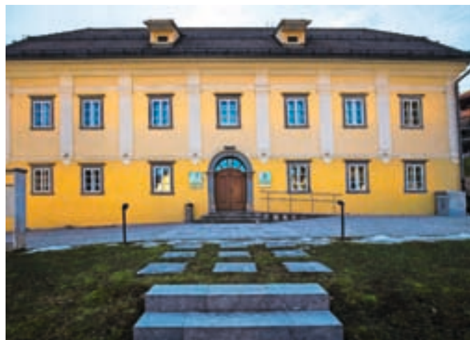
Ob dnevu turističnih vodnikov vabijo na brezplačen voden ogled čevljarske in čipkarske zbirke v Muzeju Žiri.

Turistično društvo Žiri tudi letos aktivno sodeluje z Razvojno agencijo Sora. V sklopu dogodkov ob dnevu turističnih vodnikov bo v Muzeju Žiri v torek, 21. februarja, od 15. do 18. ure možen brezplačen voden ogled čevljarske in čipkarske zbirke. Poleg ogleda zbirke bosta obe tradicionalni obrti predstavljeni tudi v živo, saj bodo poleg turističnega vodnika prisotni tako čevljar kot klekljarice. Vsi lepo vabljeni.