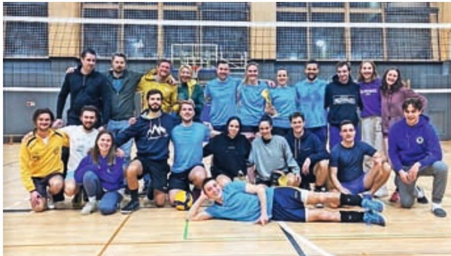
Najboljše tri ekipe na Prednovoletnem turnirju v odbojki Žiri 2022

Enajst tekmovalnih ekip, željnih zmage in dobre igre, je – pravijo organizatorji – poskrbelo, da je bila predzadnja decembrska nedelja v Športni dvorani Žiri izjemno napeta, vse ekipe pa so v borbemem in športnem duhu pokazale, kaj znajo in zmorejo. Na najvišjo stopničko je ob koncu dneva kot zmagovalka Pred-