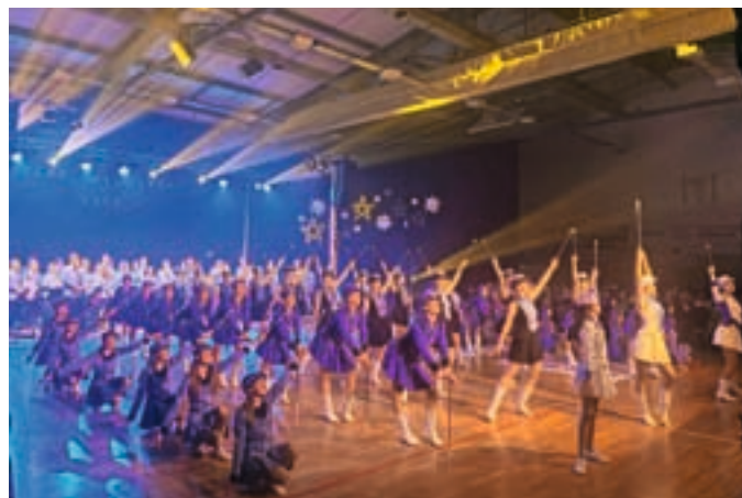
Letošnjo pustno povorko bodo popestrile tudi Trebanjske mažoretke.

Turistično društvo Žiri v sodelovanju z Občino Žiri tudi letos organizira že tradicionalno Pustno povorko, ki bo na pustno soboto, 18. februarja, z začetkom ob 14. uri. Vse maškare, male in velike, se bodo zbrale na parkirišču pred Zadružnim domom. Zabavni program, ki so ga pripravile Pike Nogavičke iz VVE pri OŠ Žiri, se začne ob 14. uri. Nastopu gostujoče skupine v organizaciji Pihalne godbe Alpina Žiri in nastopu posebnih gostij Trebanjskih mažoretke sledi pustna povorka. Maškare se bodo sprehodile po glavni cesti od Zadružnega doma do trgovine Market Spar in nazaj do parkirišča pred Zadružnim domom. V pustni povorki bodo poleg maškar sodelovale tudi Pike Nogavičke, pihalna godba in mažoretke. Po vrnitvi nazaj na parkirišče seveda sledi še zabavni program, sladkanje s krofi, bomboni in sladko peno, ne bo pa manjkalo niti pokovke in toplega čaja.