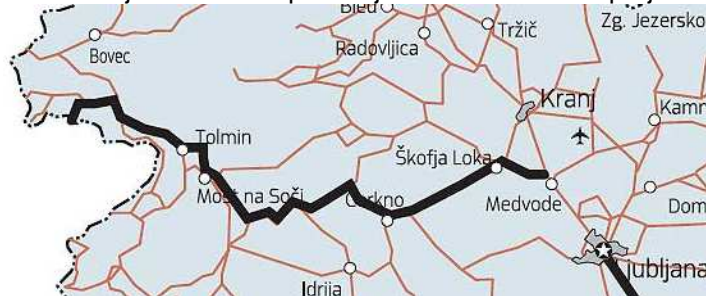
Slika 2: Potek 4. razvojne osi

Žiri) s stičiščem v Škofji Loki (Občina Škofja Loka) se Severna Primorska (Baška Grapa, Cerkno, Idrija) povezuje z Ljubljano. Tako skozi območje LAS poteka 4. razvojna os, ki Ljubljano preko Škofje Loke in Poljanske doline povezuje s Primorsko in naprej z Italijo.